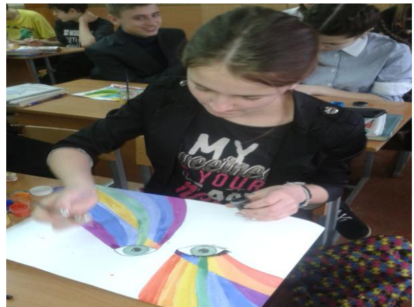
Малюнок власного настрою

Малювання спіралеподібними лініями. Педагог робить контурний нарис предметів, а учень малює по ньому фломастером або ручкою спіралеподібними лініями. Можна малювати за власним задумом.