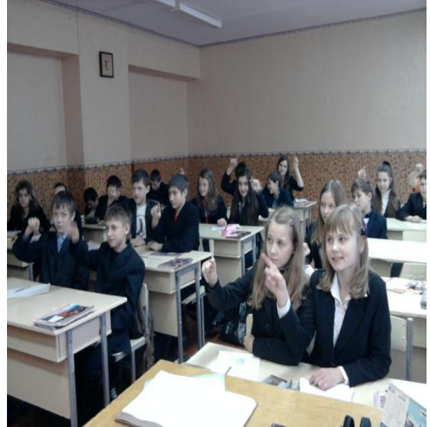
Малюнок у «повітрі»