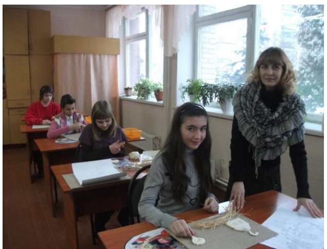
Робота з солоним тістом