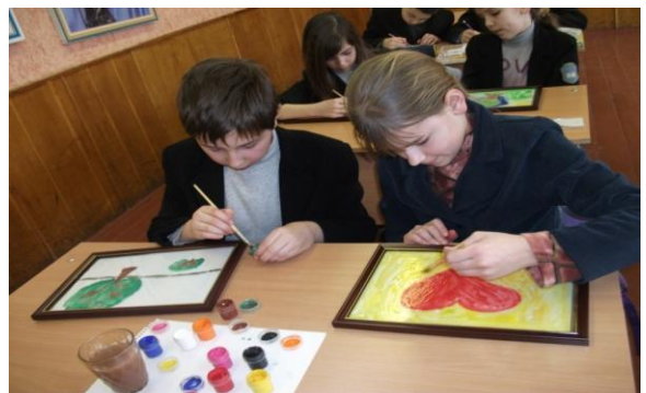
Малюнок на склі

Восковий малюнок. На аркуш паперу наноситься малюнок свічкою. Потім робота розфарбовується фарбами або крейдою.