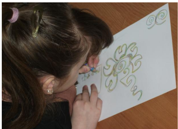
Малюнок спіралеподібними лініями та зигзагами