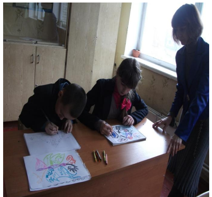
Перемога над страхом