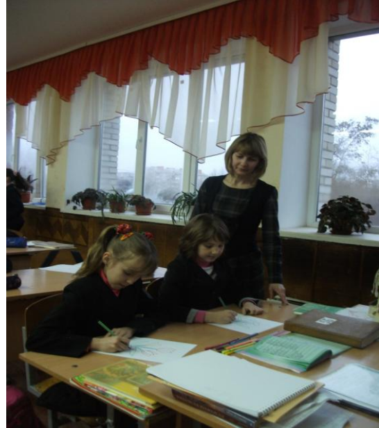
Малювання по крапках

Чарівні плями. Учні пропонуються виконати малюнок у техніці монотипії або кляксографії, назвати зображення і придумати історію.