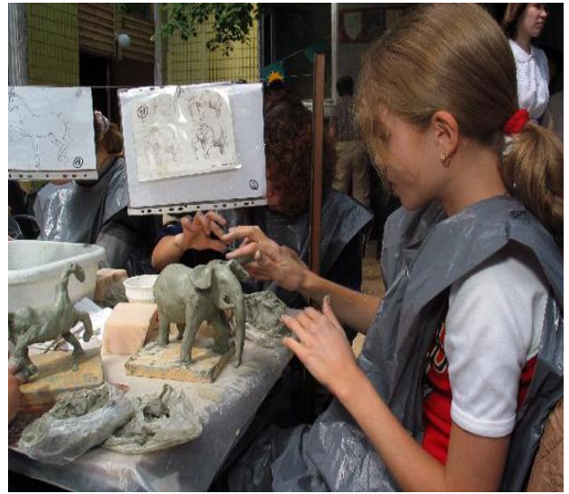
Ліплення з глини

Гра з тістом. Педагог пропонує створити об'ємні та рельєфні зображення з солоного або керамічного тіста.